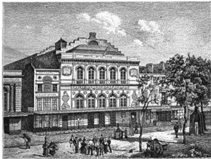
Théâtre de la Gaîté (boulevard du Temple à Paris), démoli en 1862